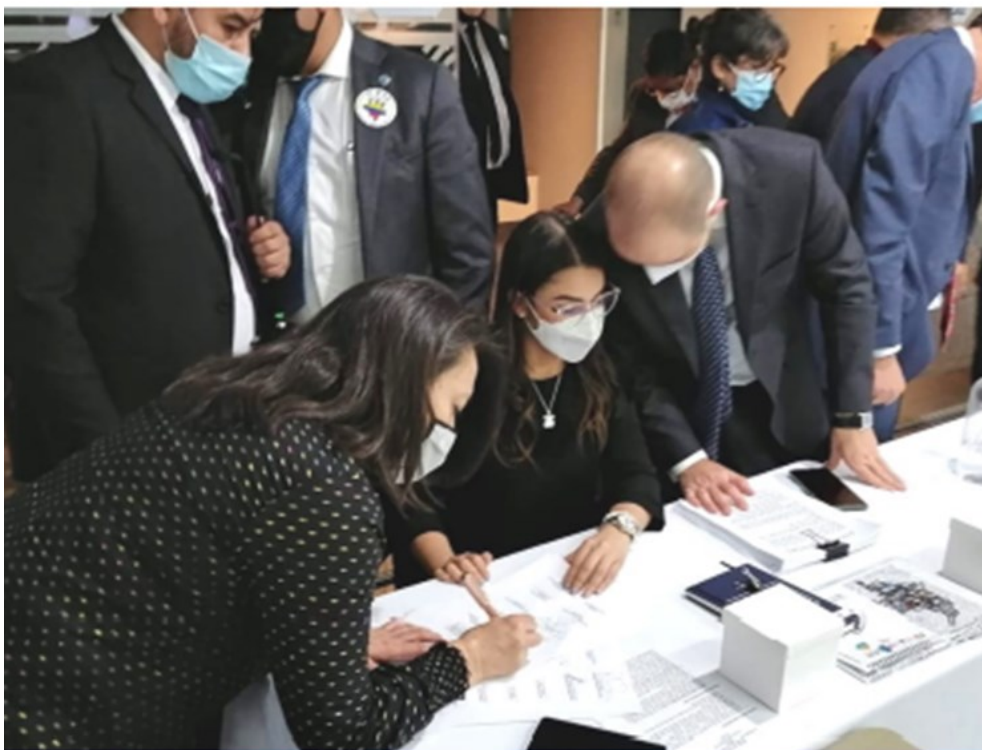
Firma del Acuerdo, Sede del DAFP, 19 de agosto de 2021

ASDEP también aclara que la información dada sobre la bonificación no es cierta, se espera que dicha bonificación se materialice el primer semestre de 2022, y la misma será objeto de concepto del DAFP , que se emitirá en el marco de la implementación de los acuerdos. A la fecha no hay respuesta del DAFP, y se tiene como fecha límite para dicha respuesta el día 10 de diciembre de 2021, luego de lo cual se deberá instalar la Mesa Técnica como quedó acordado en el Acuerdo Nacional Estatal 2021. (Ver: https://cut.org.co/acta-final-acuerdo-nacional-estatal-2021/?amp ) PARAGRAFO 2. Dicho estudio tendrá como temas centrales y objeto de esta, la propuesta de nivelación salarial entre la Defensoría del Pueblo con la Procuraduría General de la Nación, con las demás entidades del sector, propuesta de primas, bonificaciones y otros emolumentos de carácter salarial y no salarial para los empleados de la Defensoría del Pueblo, documento técnico que será remitido dentro de los diez (10) días siguientes a la finalización de la construcción de este a Función Pública para validación técnico-jurídica.