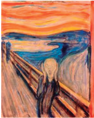
El Grito: Edvard Munch