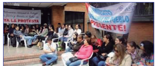
ASDEP Solidaria con la justa reclamación de los trabajadores de la Rama Judicial por la NIVELACION SALARIAL

Otra importante lección tiene que ver con la sorprendente motivación del paro, resulta un tanto Kafkiano que sea necesario