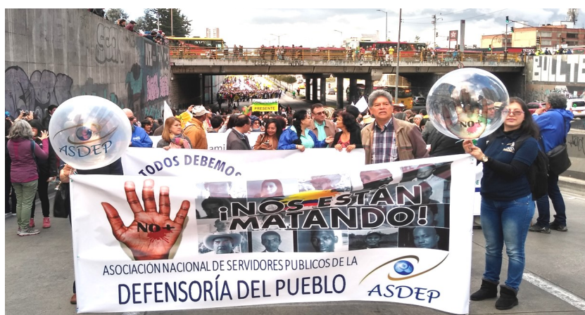
Marcha por la Vida 26 de julio 2019

De manera respetuosa invitamos al Señor Defensor a recibir al Comité Ejecutivo de FECODE para precaver escenarios de mediación ante la inminencia de un Paro Nacional Indefinido que se viene anunciado de manera insistente por el incumplimiento de los acuerdos suscritos con los maestros y ahora por las amenazas a la integridad y vida de los maestros, y dirigentes sindicales de nuestro país.